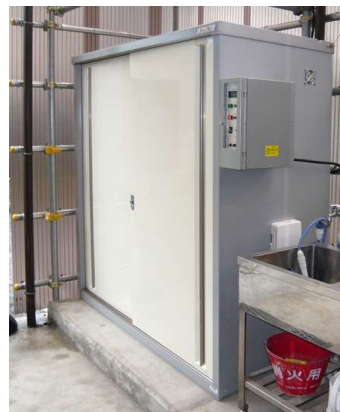
プラント現場での合羽乾燥