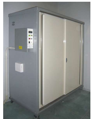
水産加工会社での防寒着乾燥