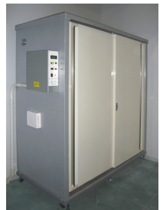
水産加工会社での防寒着乾燥