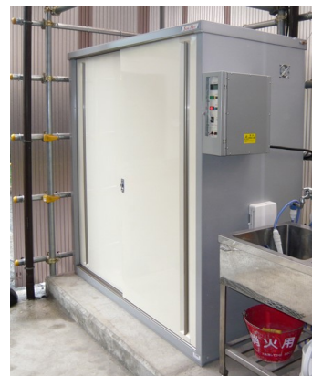
プラント現場での合羽乾燥