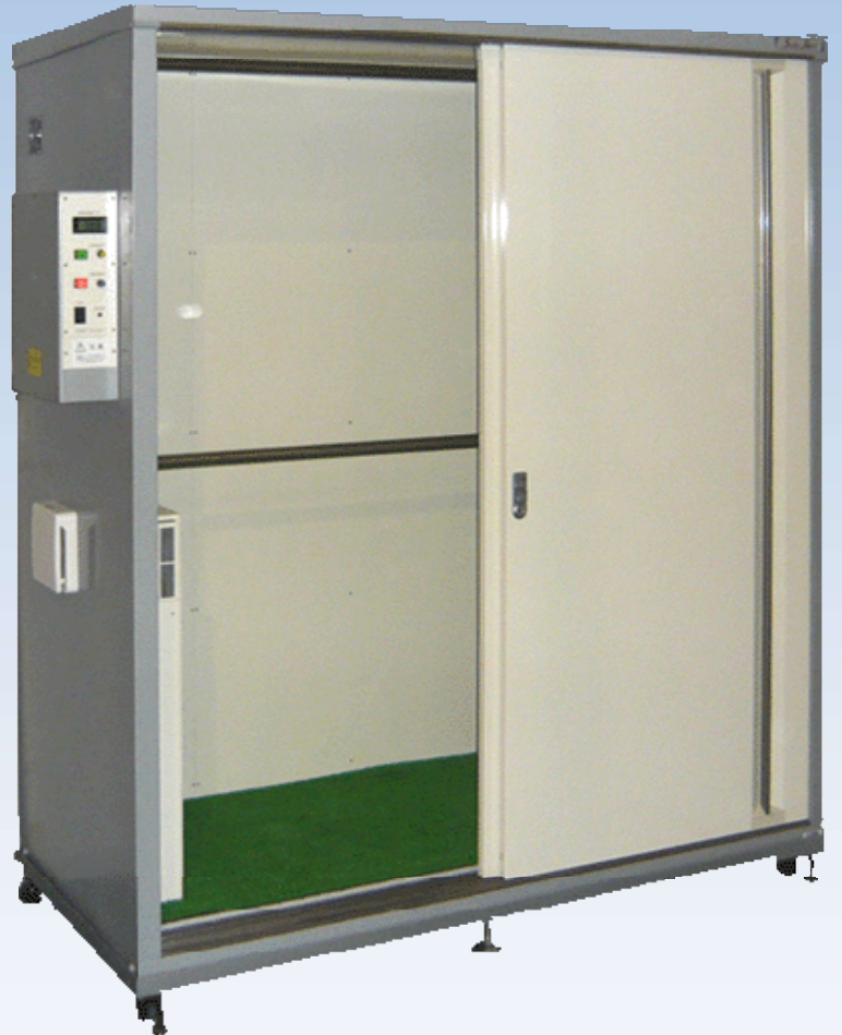
写真はES-1700S(L)室内設置型型 ※オプションオゾン発生器・キャスター取付・制御盤防滴構造