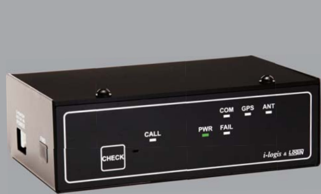
FOMAモジュール内蔵車載端末